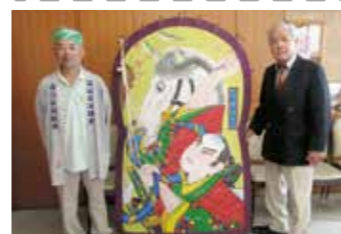
主催:秋なすび 会場:1階オープンラウンジ白壁前

徳川家光絶賛 丸亀藩曲垣平九郎 出世の石段『大風』展 ～何故、東京港区の神社が中讃地区伝統文化のルーツになったのか?～