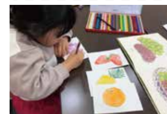
主催:さとみアートスクール 会場:1階市民展示コーナー

子ども作品を中心に、3歳～81歳までの方が自由に描いた色彩豊かでパワーある作品を展示します。毎週作品を入れ替え、「楽しく元気の出る」迎春展です。この機会に気軽にアートに触れてみませんか？